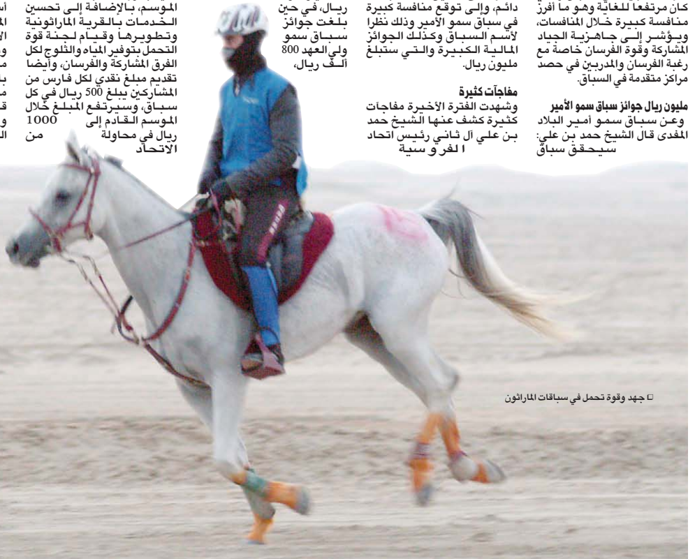
جهد وقوة تحمل في سباقات الماراثون

لمليون ريال جوائز سباق سمو الأمير وعن سباق سمو أمير البلاد المفدى قال الشيخ حمد بن علي: سيحقق سباق